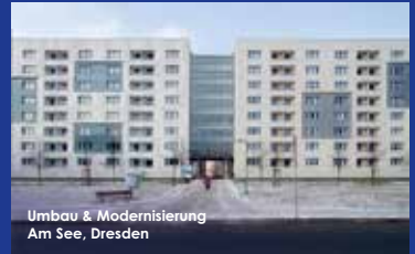
Umbau & Modernisierung Am See, Dresden