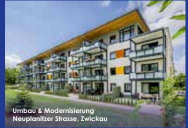
Umbau & Modernisierung Neuplanitzer Strasse, Zwickau