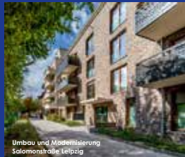
Umbau und Modernisierung Salomonstraße Leipzig