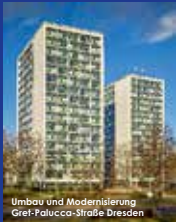
Umbau und Modernisierung Gref-Palucca-Straße Dresden